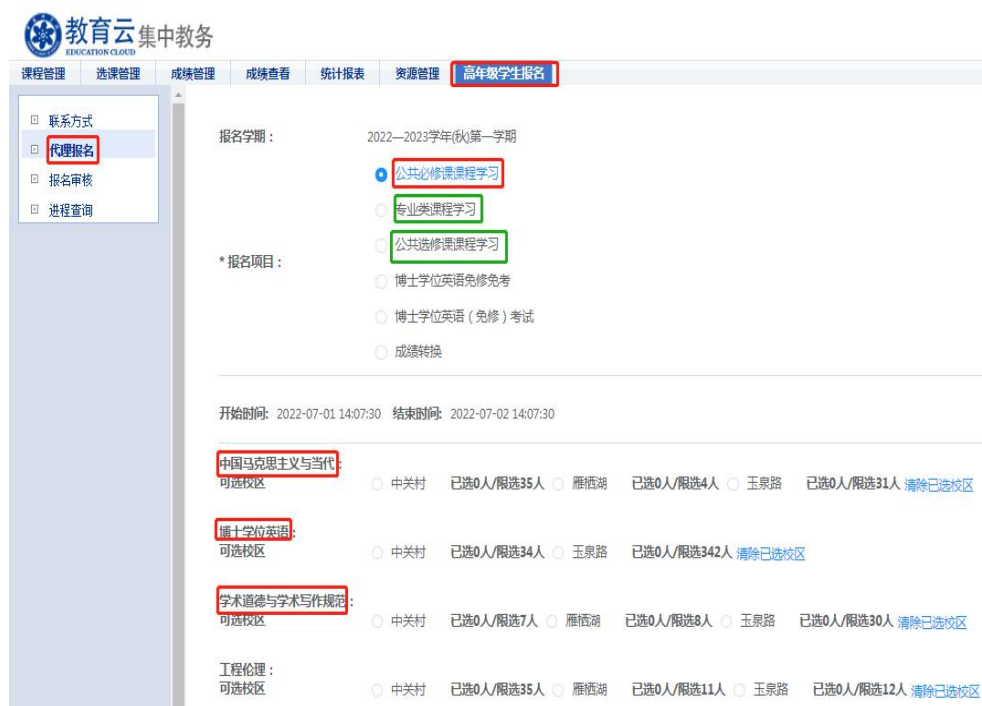
图 5 教育干部代理报名界面