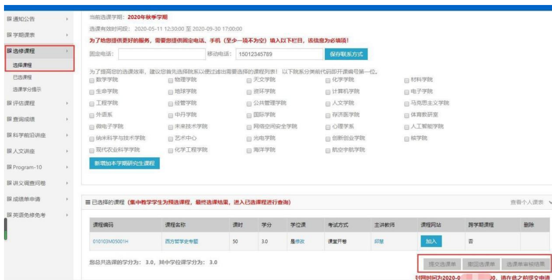
图 6 选课界面