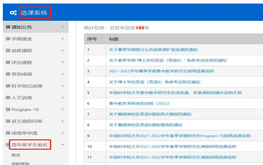
图 1 选课系统界面