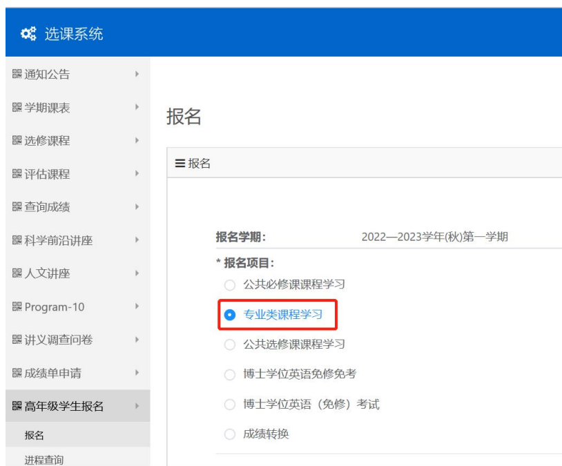
图 4 “专业类课程” 报名界面 (“专业类课程” 为例)