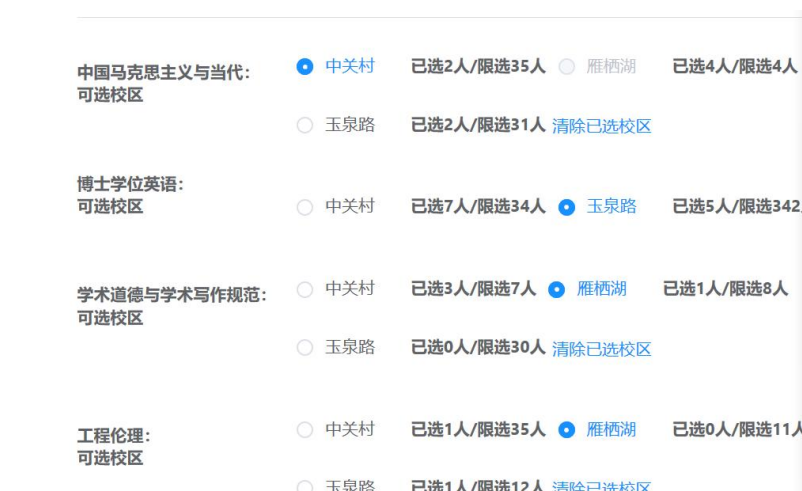
图3 “公共必修课”课程报名

第三步，学生报名“公共必修课课程学习”项目时，须点击课程对应的校区，单击“点击报名”，即完成报名，见图3。